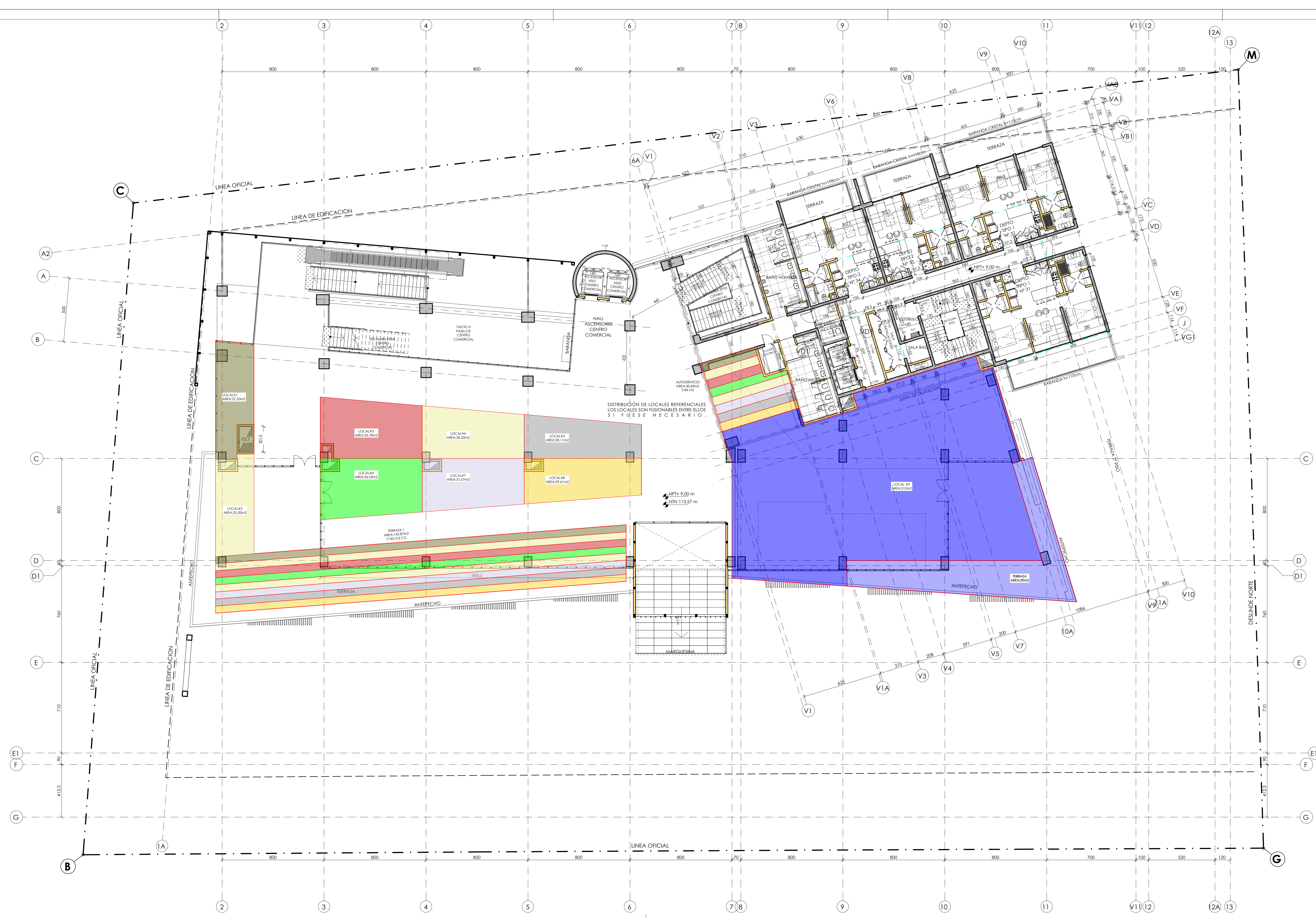
CENTRO COMERCIAL Y VIVIENDAS PASEO DUNAS PLANTA GENERAL 3° PISO (845 m2) AV. GASTON HAMEL NIETO N° 527 ESCALA: As indicated