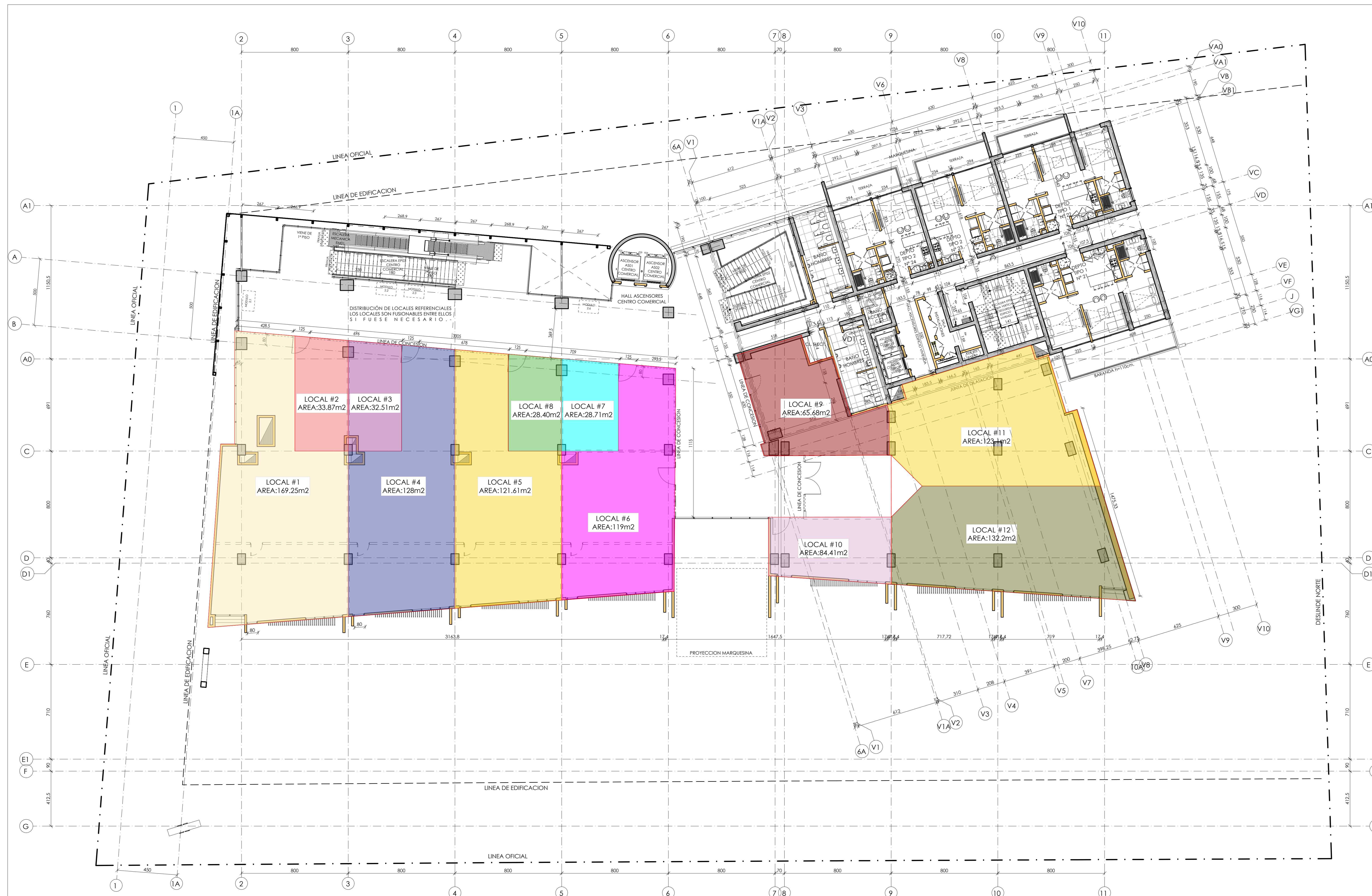
CENTRO COMERCIAL Y VIVIENDAS PASEO DUNAS PLANTA GENERAL 2º PISO (1.067 m2) AV. GASTON HAMEL NIETO N° 527 ESCALA: As indicated